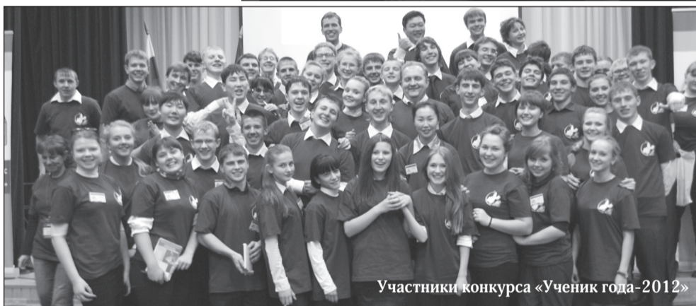
Участники конкурса «Ученик года-2012»

Он – единственный сын, при этом, похоже, не избалован, а, наоборот, – воспитан в лучших традициях, когда ответственность друг за друга и поддержка родных исходят из сердечной близости.