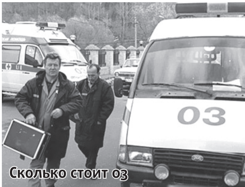
СКОЛЬКО СТОИТ 03

Премьер РФ Дмитрий Медведев утвердил новые правила предоставления платных медицинских услуг. Новые правила, вступающие в силу с 1 января, запрещают оказывать предпочтение коммерческим пациентам. Согласно опросам РОМИР, а в этом году 67% россиян пользуются платными медицинскими услугами. Число тех, кто не может оплатить никакие медицинские услуги, - 9%. Государство не устраивает то, что в медицине не сокращаются теневые платежи. По идее, постановление должно наконец навести порядок в этих вопросах. В нем подчеркивается: при заключении договора на платную услугу