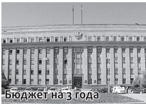
Бюджет на 3 года

Конкурс проводится по четырем номинациям, по итогам которого будут определены восемь победителей, по два в каждой номинации.