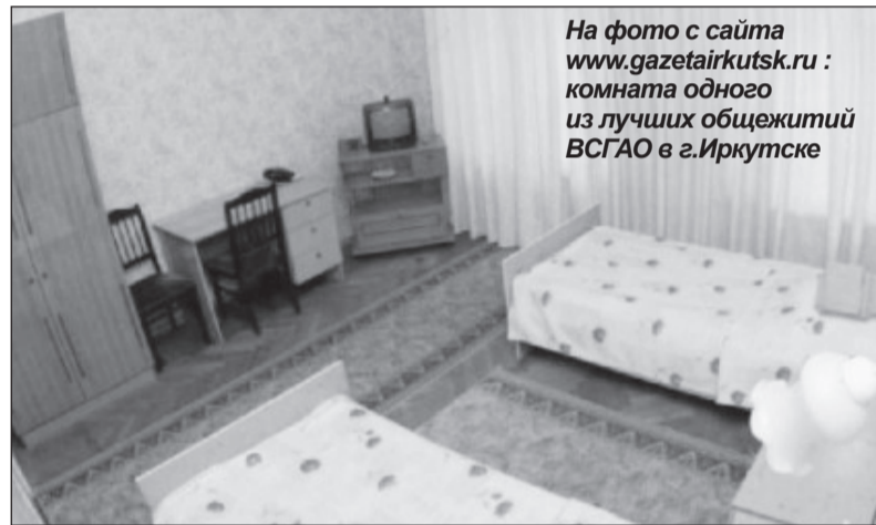
комната одного из лучших общежитий ВСГАО в г.Иркутске

Министерством юстиции РФ зарегистрирован приказ Министерства образования и науки РФ, регулирующий размер платы за проживание в студенческих общежитиях.