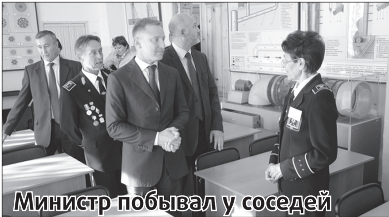
Министр побывал у соседей

Министр образования и науки России Дмитрий Ливанов 22 сентября провел рабочий визит в Забайкальском крае, - об этом сообщает официальный сайт министерства.