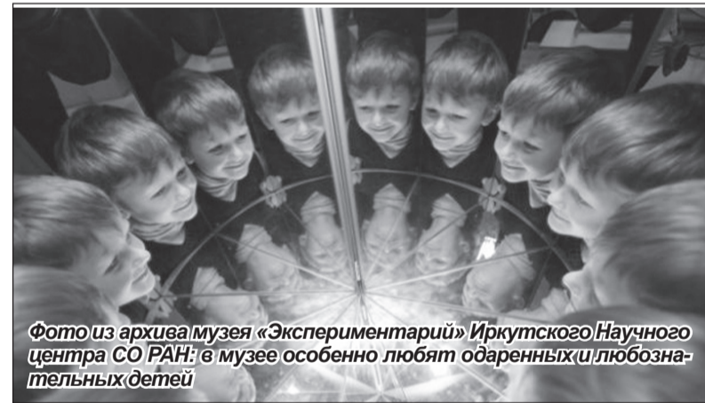
в музее особенно любят одаренных и любознательных детей

На данный момент в России не так уж и много образовательных учреждений для обучения одаренных де-