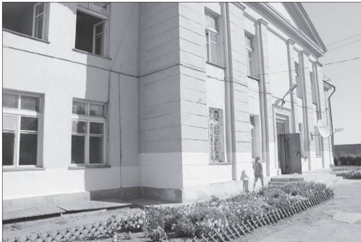
На фото с сайта www.irdeti.ru : здание в пос. Тельма, в котором размещалась коррекционная школа-интернат, а ныне - спецшкола.

министерство приняло постановление №650 от 19.06.2014г. «Об организации работы по изменению мест нахождения государственных образовательных организаций Иркутской области», на основании которого в Тельме была закрыта коррекционная школа.